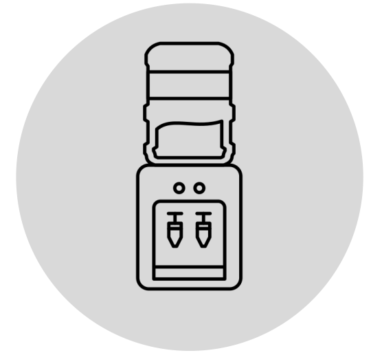
Les fontaines à eau

L'ANRH met en place une formation certifiante de réparateur SAV H/F en partenariat avec le Cap Emploi et le réseau Ducretet dans le cadre d'un CDD Tremplin de 18 mois.